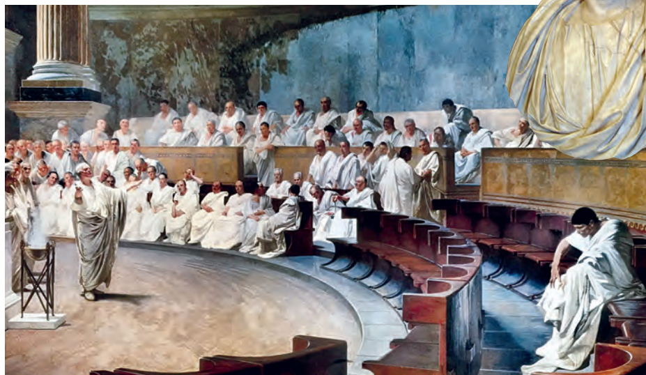
Cicéron dénonce Catilina, entre 1882 et 1888, fresque de Cesare Maccari, palais Madame, Rome.

Série. Théoricien de la loi naturelle, Cicéron influença les légistes français. Il peut être considéré comme l'un des pères de l'Europe.