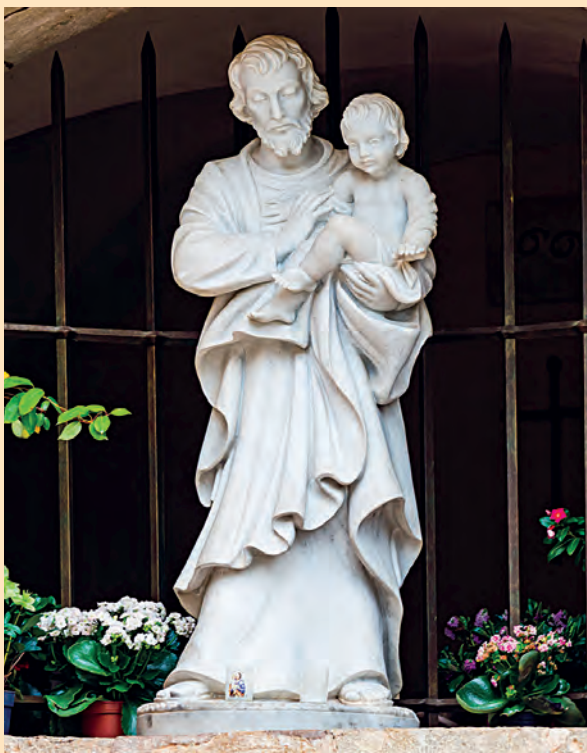
Statue de saint Joseph et Jésus au Bessillon.