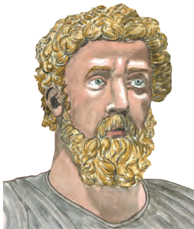
Ci-dessus, l'empereur Marc-Aurèle.

« Honestum » qui l'accompagne, dérivé de honos , va plus loin. Il englobe le beau, l'honnête et le vertueux. Pour accéder à l' honestum , Cicéron suggérait de discerner entre : « l'honorable, l'extraordinaire, l'insignifiant, le douteux, l'obscur ». Dès lors, il faut comprendre que la véritable dignité comporte l'observance des fondements moraux. Seule, une conduite moralement droite constitue le souverain bien et doit guider