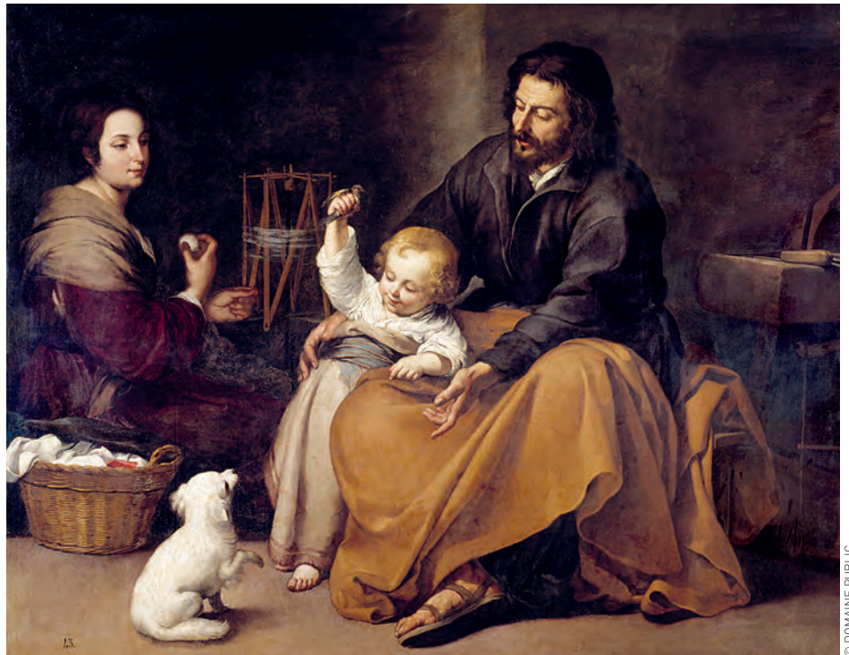
La Sainte Famille au petit chien, vers 1650, de Bartholomé Estéban Murillo, huile sur toile. Musée du Prado, Madrid.

Comme tout père juif, il éduque son fils et l'initie à la prière, pour le préparer à la barmitsva – le passage à l'âge adulte –, vers 12 ans, lui permettant de prendre la parole pour la première fois dans la synagogue. C'est extraordinaire d'imaginer que Joseph a introduit le Verbe