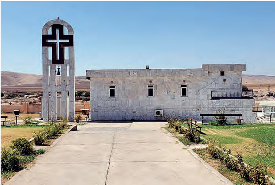
Église assyrienne dans la vallée du Khabour, en Syrie.

La guerre en Iran, élargie à de nombreux pays, redistribue les cartes au Moyen-Orient. Comment préserver la place des chrétiens dans cette région traversée par les crises et les conflits ? L'analyse de Loÿs de Pampelonne, directeur de recherche sur le Moyen-Orient de la revue Conflits .