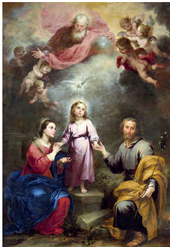
Trinité et Sainte Famille, entre 1675 et 1682, Bartolomé Esteban Pérez Murillo, huile sur toile, National Gallery de Londres.

On dira alors que Jésus-Christ, bien loin d'être venu sur terre pour sacrali-