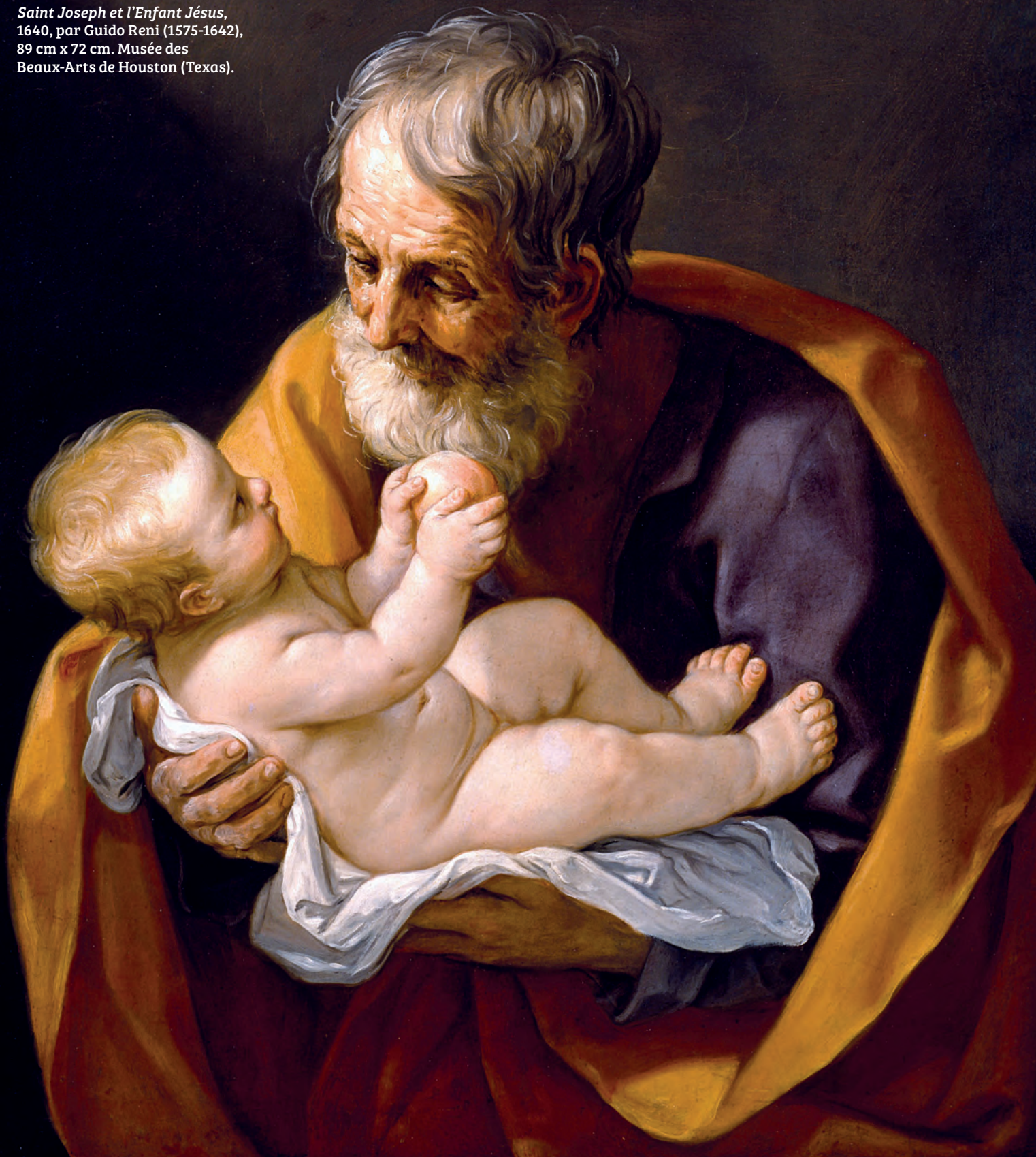
Saint Joseph et l'Enfant Jésus, 1640, par Guido Reni (1575-1642), 89 cm x 72 cm. Musée des Beaux-Arts de Houston (Texas).