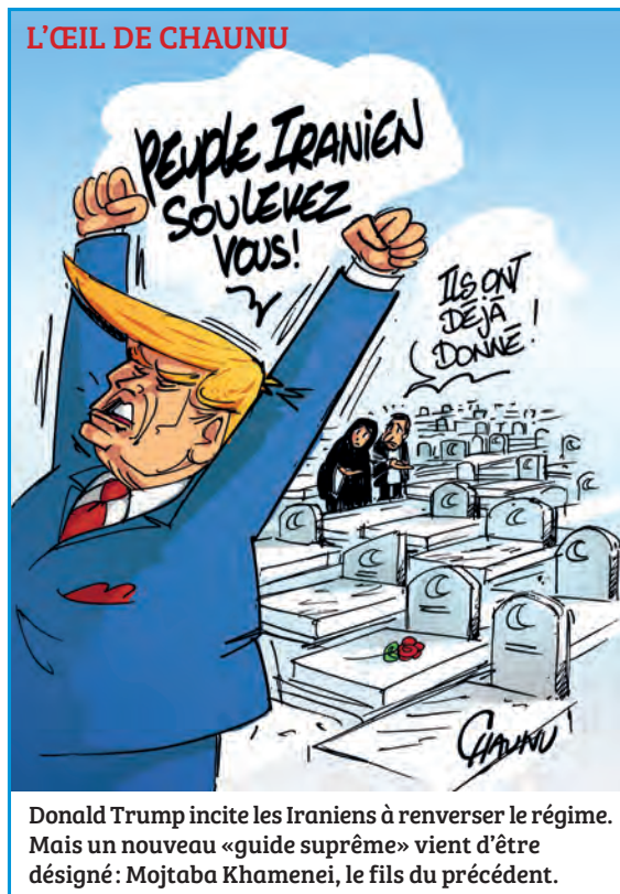
Donald Trump incite les Iraniens à renverser le régime. Mais un nouveau «guide suprême» vient d'être désigné: Mojtaba Khamenei, le fils du précédent.

Engluer les États-Unis dans un conflit de longue durée, pour mettre en porte-à-faux Donald Trump avec sa base électorale, alors que se rapprochent les élections de mi-mandat (mid-terms) prévues en novembre, peut en effet expliquer la fuite en avant du régime des mollahs. Dans une même logique, cette escalade vise peut-être aussi à provoquer une violente déstabilisation économique, intenable à terme. « Téhéran cherch[erait] à perturber les marchés pétroliers et gaziers pour créer une pression économique ou bien à pousser "les capitales arabes à intervenir auprès de Washington en faveur d'une désescalade" », souligne le quotidien québécois Le Devoir (02/03), citant Pierre Pahlavi, professeur et directeur du département de la Sécurité et des Affaires internatio-